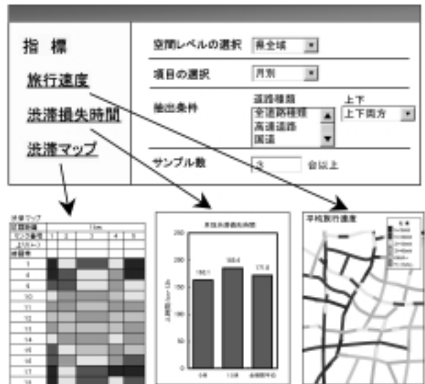
図 プロブデータを活用した道路管理支援システム

所内システムを構築・運用してきた経験・技術に基づき、外部機関の情報システムに対する調査分析、提案およびシステム構築などのコンサルティングを行っています。最新技術の動向を踏まえ、業務改善のためのシステム提案やセキュリティ対策、システムの運用管理を合理化する各種ツールの導入などを実施しています。