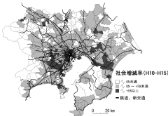
図 東京都市圏の社会増減の動向（H10 - H15）

地方都市に関しては、各地域の持つ既存ストックの活用に着目し、鉄道駅周辺の新たな都市拠点づくりやIC整備にあわせた生活・産業支援交流拠点づくりに向けた事業化の仕組み、公益施設のストックマネジメントについて各分野の専門家等との議論に基づき、研究・提案を行っています。