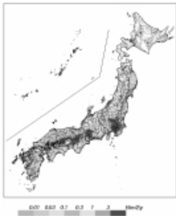
図 - 1 日本における NOx 排出量分布