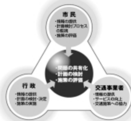
図 協働型交通まちづくりイメージ

市づくり・まちづくりに向けた地域参加型の戦略づくりが求められつつあります。特に、長期未整備の都市計画道路がみられる中で、既存交通施設空間を有効活用していく需要管理策、整備プログラムの立案等が課題となっており、市民・企業、交通事業者とともに知恵と工夫を凝らした交通まちづくりを進めて行く素案づくり、その実現に向けた協働プロセスについて調査研究・提案を行っています。