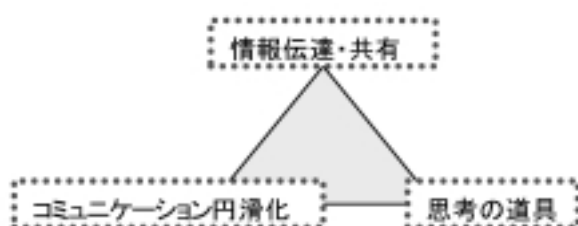
図-1 ことばの3つの役割

言語情報研究室では、情報伝達および共有の手段、コミュニケーション円滑化の手段、思考の道具としての言語に関する様々な角度からの分析研究を行っています。