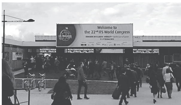
写真-1 第22回ITS世界会議 会場 (フランス・ボルドー)

第22回ITS世界会議はボルドーの市街地からトラムで約20分ほどのCongre et Expositions de Bordeaux(ボルドー会議・展示場、写真-1)で開催され、102ヶ国から約1万2千人が参加した。