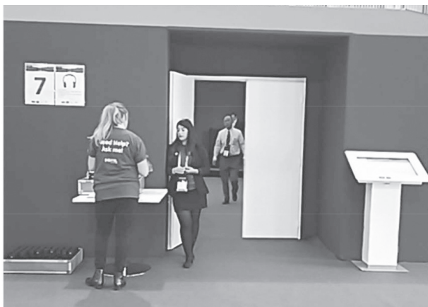
写真-4 Technical/Scientific Sessions会場