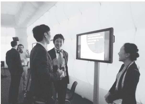
写真-3 Interactive Sessionsの様子(質疑応答)