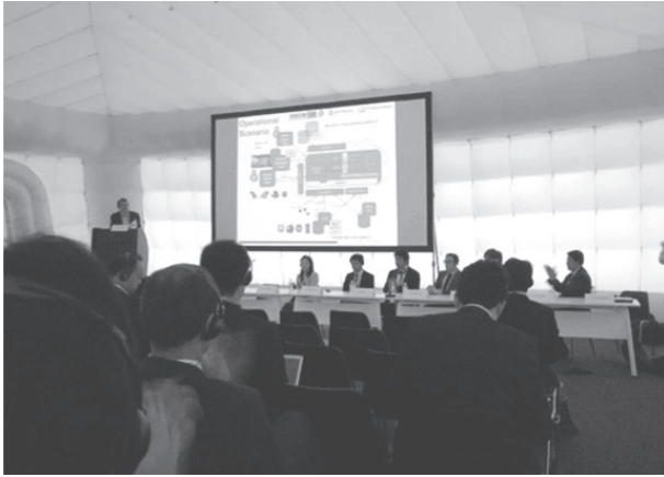
写真-2 Interactive Sessionsの様子(口頭発表)

見舞われた。発表者は私物のノートPCを手に抱えて聴講者にスライドを見せながら、マイクを通さず地声で発表するという状況の中でセッションが進められた。停電は30分程度で解消し、その後のプログラムは予定通り行われたものの、電力の安定供給の重要性を、異国の地で改めて痛感した次第であった。