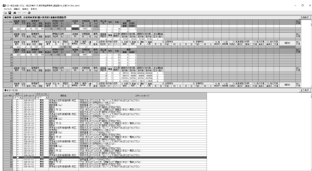
図-3 交通実態調査データチェックシステムの画面イメージ