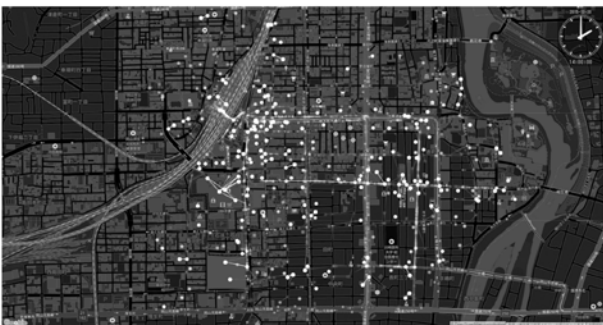
図-1 スマート・プランニングにおける 歩行者シミュレーションの可視化 (Mobmapを使用)

データサイエンス室は、約15名のスタッフで始動しました。統計データ解析、GIS・ネットワーク解析、数理モデル、Webやシステム開発等の高度な技術を担うITマネージャーが中心となって、これらの取り組みを進めています。